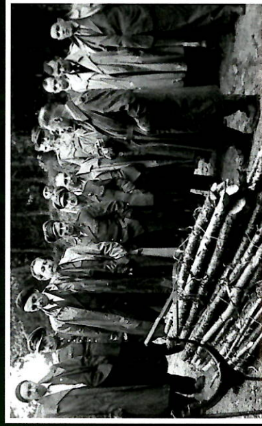
Uczestnicy szkolenia. Lata 50-60. XX wieku.