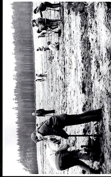
Sadzenie lasu na terenie Nadleśnictwa Solca Kujawski. 1985 r.